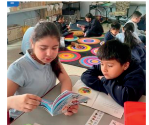
4th grade students with their 1st grade reading buddies!