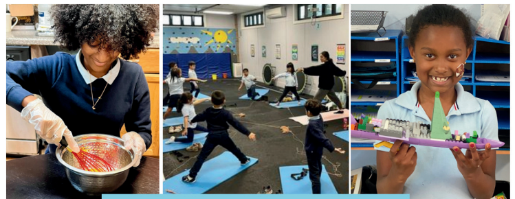
Scenes from last year's Exploratorium!

As for sports, soccer is starting up this fall, and we will be kicking off our basketball season this upcoming winter. Look out for baseball in the spring!