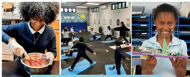
Escenas del Exploratorio del año pasado!

En cuanto a los deportes, el fútbol comenzará este otoño y comenzaremos nuestra temporada de baloncesto este próximo invierno. Estén atentos al béisbol en la primavera!