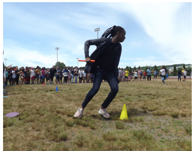
Throwback to Field Day in 2018!

Elementary and Middle Grades' field days are happening in June. These are days when students and teachers go to the field and play games together to celebrate the end of the school year! We can't wait to get outside and play after all the hard work we accomplished this year!