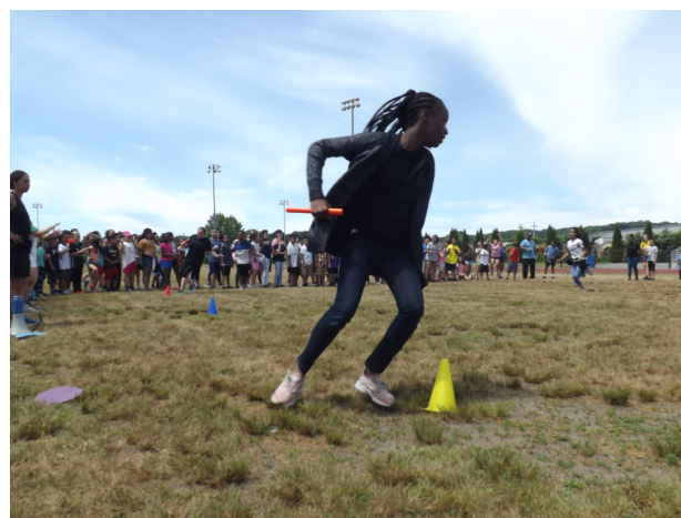
Día de Campo en 2018!

Los días de paseo de los grados elementales e intermedio están sucediendo en junio. Estos son días en que los estudiantes y los maestros van al campo y juegan juntos para celebrar el final del año escolar! Nos morimos de ganas de salir y jugar después de todo el duro trabajo que logramos este año!