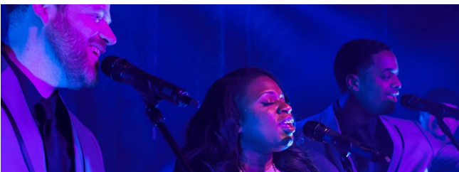
La banda en vivo de este año es Groove Authority!

Visiten www.thelearningcommunity.com/site/getsmart para obtener más información y conseguir sus entradas.