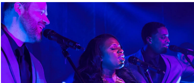
This year's live band is Groove Authority!