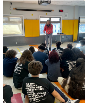
Visit by RI Black Storytellers