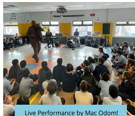
Live Performance by Mac Odom!