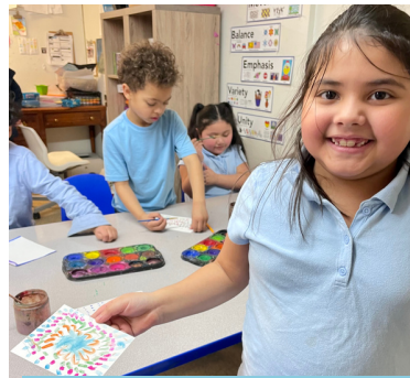
2nd grade artwork inspired by Black painter, Alma Thomas