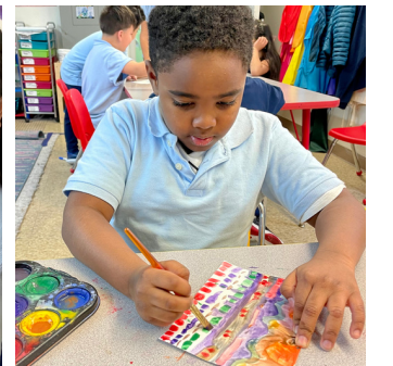
Obra de arte de 2do grado inspirada en la pintora negra, Alma Thomas