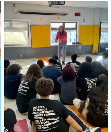
Visita de Cuentistas Negros de RI