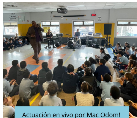
Actuación en vivo por Mac Odom!